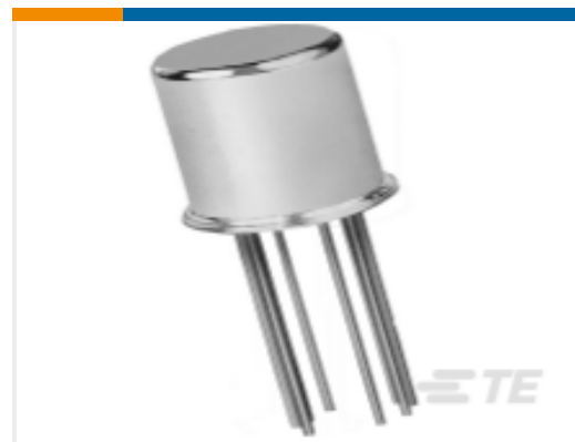
TE 产品编号1617164-7 JMACT-5XL = M28776/1-025L