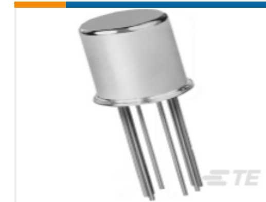
TE 产品编号1617164-7 JMACT-5XL = M28776/1-025L