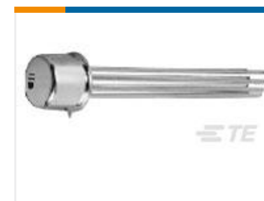
TE 产品编号1617119-5 J1MAW-18XP = M39016/7-021P