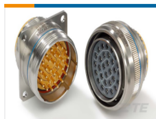
TE 产品编号ZPF000000000007174 983-ORS 08-98 PN