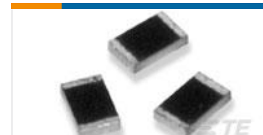
TE 产品编号3-1879267-8 RP 2B 909K 0.1% 15PPM 1K RL