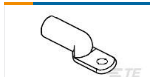
TE 产品编号277148-3 TERMINAL,COPALUM R 6 5/16