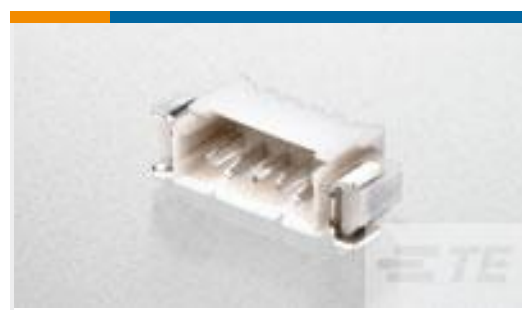
TE 产品编号3-1734261-2 1.25 WTB PLUG RA 30U" 2 POS