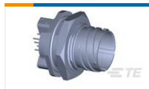
TE 产品编号2102351-4 CeeLok FAS-T, Recept, Kit, PCB,ZnNi,A