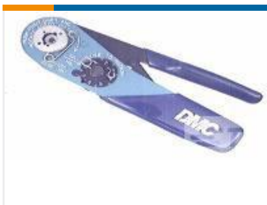
TE 产品编号 601966-1 CRIMPING TOOL M22520/2-01