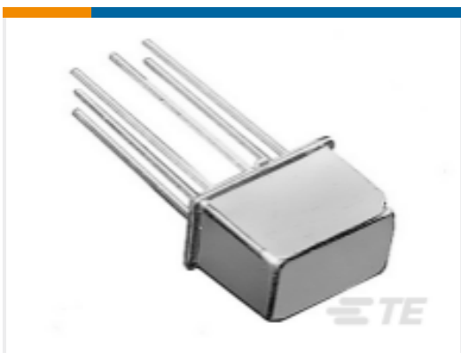
TE 产品编号1617147-5 JMGAP-26P = M39016/17-030P