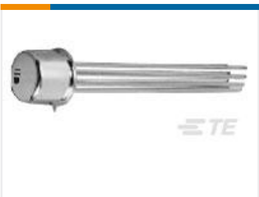
TE 产品编号1617119-5 J1MAW-18XP = M39016/7-021P