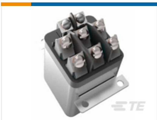
TE 产品编号1617807-5 FC-335-SY8= RELAY, 3PST