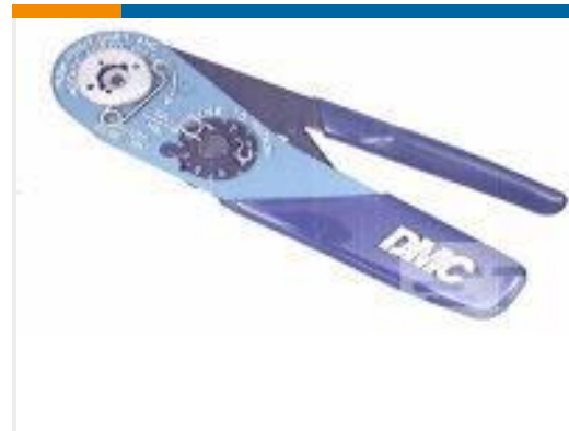
TE 产品编号 601966-1 CRIMPING TOOL M22520/2-01