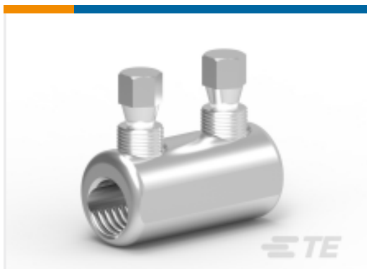
TE 产品编号2107421-1 BSLB-35/95