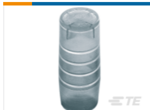
TE 产品编号300158-000 GURO-CEC-11/16