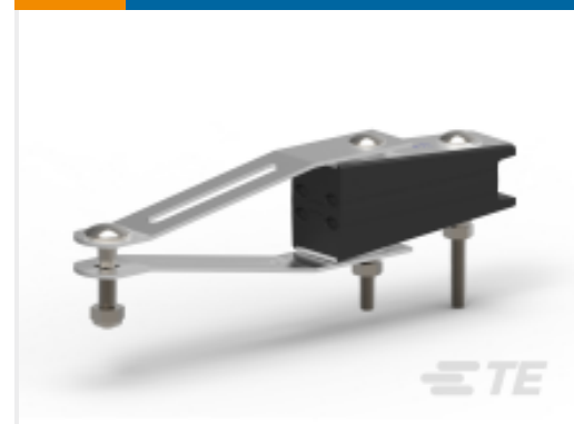
TE 产品编号2832095-2 PA4X50-95 (120) MA