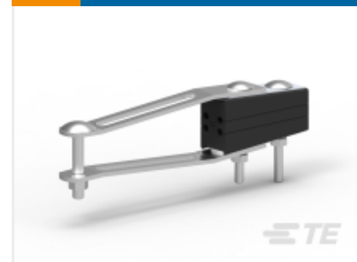
TE 产品编号331004-000 HEL-5503