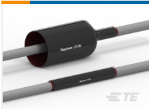
TE 产品编号359475-000 CRSM-53/13-500/239(S10)