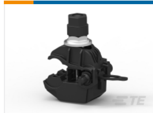
TE 产品编号1727912-3 EP95-13