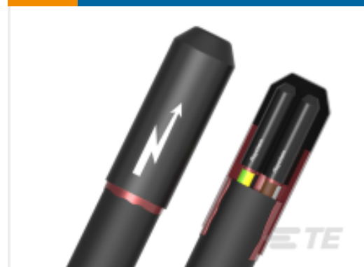
TE 产品编号248047-000 EPKE-0064-DE01