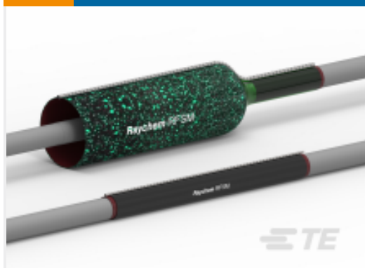
TE 产品编号186312-000 RFSM-95/30-750/123