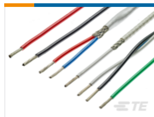
TE 产品编号 1864273001 99M0111-16-54