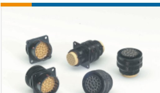
TE 产品编号ZPF000000000018493 FDBA 50-22-41 SW-K 059