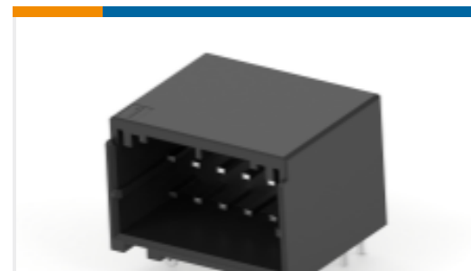
TE 产品编号1-1827876-4 Dynamic 1200 HDR 组件