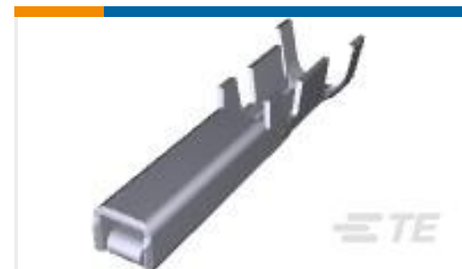
TE 产品编号1-353717-2 DYNAMIC D-3 REC CONT. 3L AU 0.38 L/P