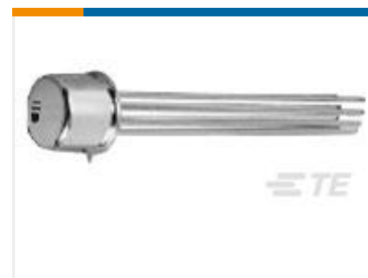
TE 产品编号1617119-5 J1MAW-18XP = M39016/7-021P