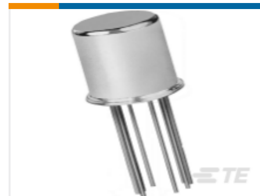
TE 产品编号1617164-7 JMACT-5XL = M28776/1-025L