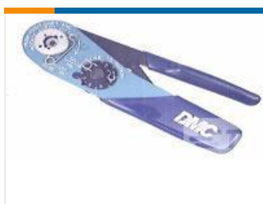
TE 产品编号 601966-1 CRIMPING TOOL M22520/2-01