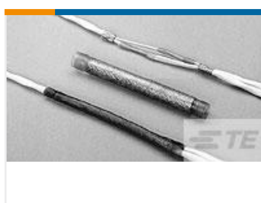
TE 产品编号522161-000 D-150-0228