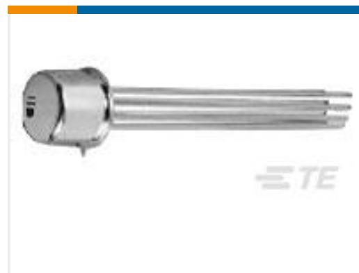
TE 产品编号1617119-5 J1MAW-18XP = M39016/7-021P