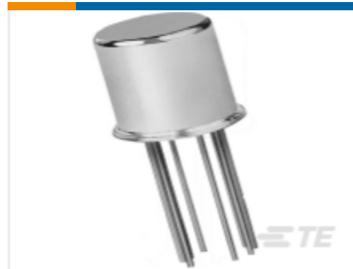
TE 产品编号1617164-7 JMACT-5XL = M28776/1-025L