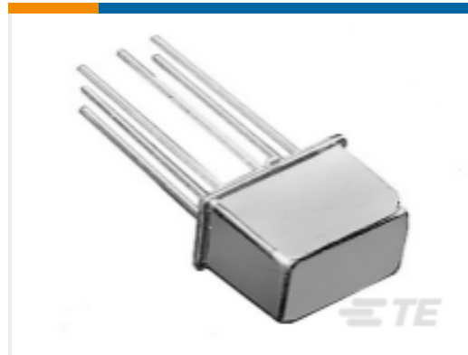
TE 产品编号1617147-5 JMGAP-26P = M39016/17-030P