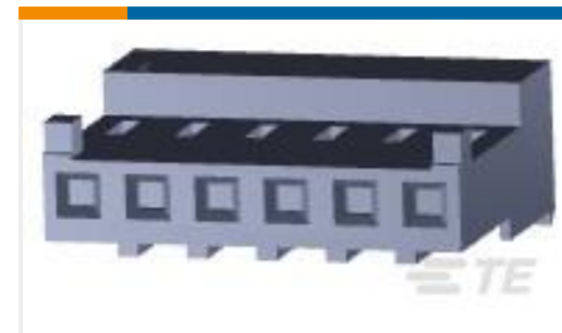
TE 产品编号3-644463-6 06P MTA156 CONN ASSY 22AWG RED TPBR