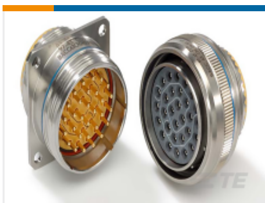
TE 产品编号ZPF100000000007721 983-0SE 24-30 SN-L