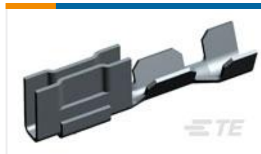
TE 产品编号1375819-3 CST-100 II CONTACT 30 GOLD PLT