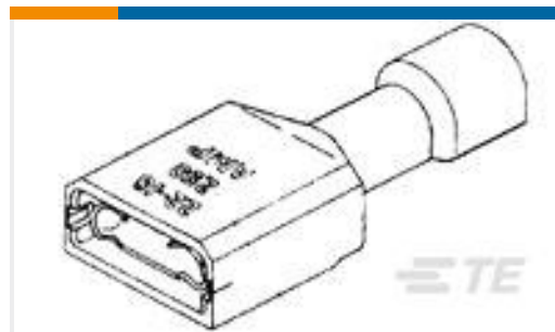
TE 产品编号2-520979-2 ULTRA-FAST .110/.125 ASY REC 22-18 TPBR