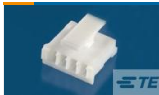
TE 产品编号1735447-4 HPI 2.0 RECEPTACLE HOUSING, 4P