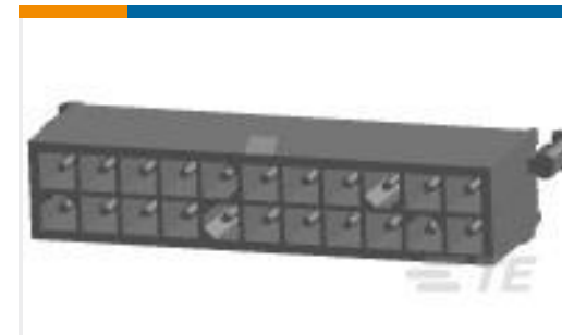
TE 产品编号1-794071-0 22P MINI UMNL HDR W/DH SN LF