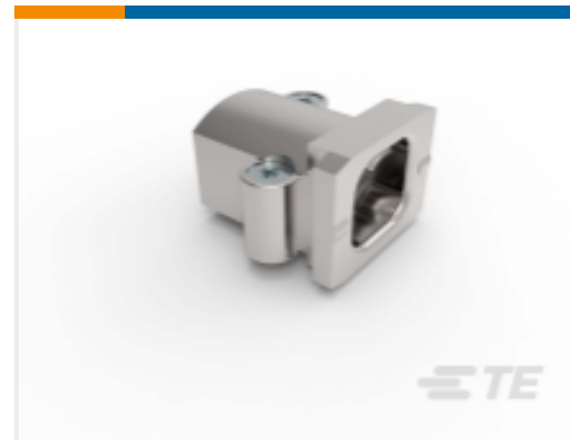
TE 产品编号1-2308272-3 CABLE CLAMP3 (CASE RAW)