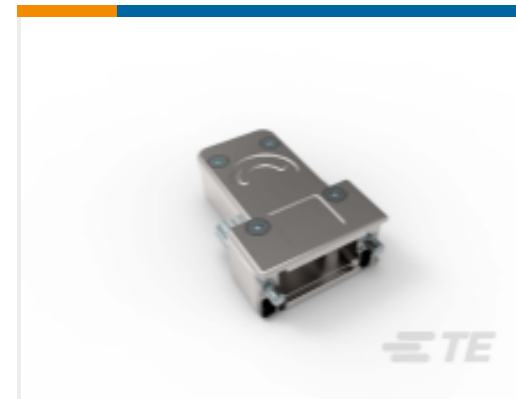
TE 产品编号1-2308340-3 FULL METAL HOODS SIZE 1-3 (RAW 180 DEG)