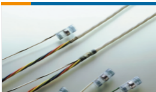
TE 产品编号467908N003 S02-08-R-9CS816