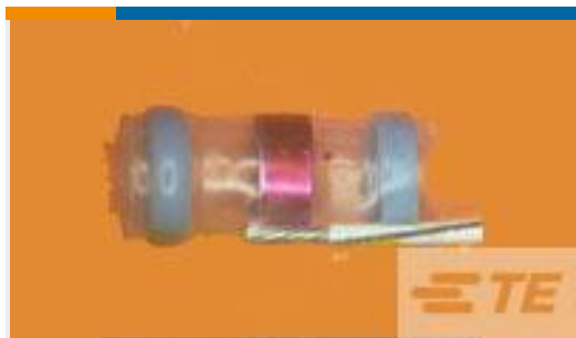
TE 产品编号932425N002 S02-08-R-6CS816