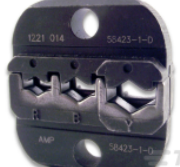
TE 产品编号 58423-1 DIE, RBY IS9252