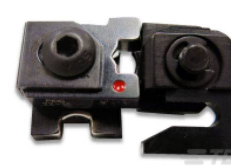
TE 产品编号 47806-2 DIES PIDG 22-16 DIE SET