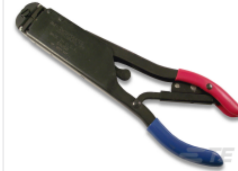
TE 产品编号 59250 T-HEAD PIDG 26-14 ASSY