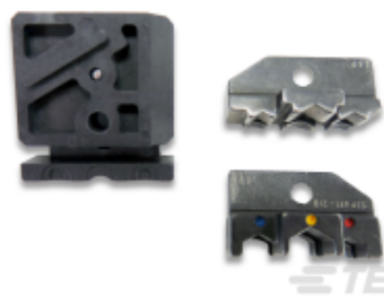
TE 产品编号 539691-2 ERGO DIE R.B.Y