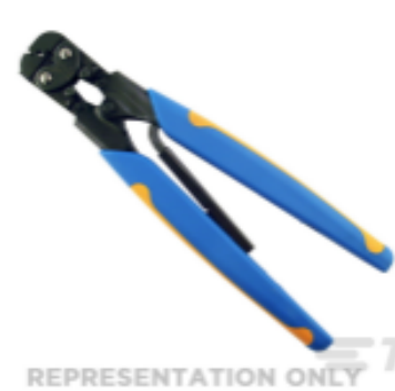
TE 产品编号 47386 DAHT PG PIDG 26-16 ASSY