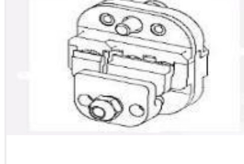
TE 产品编号 2063030-1 SDE DIESET, RBY, UL