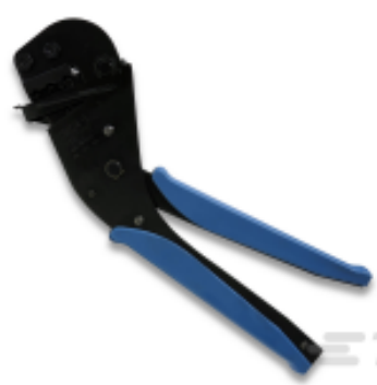
TE 产品编号 59824-1 TETRA-CRIMP PIDG PG FASTON 22-10 ASSY