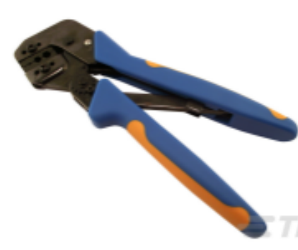
TE 产品编号 58433-3 PRO CR ASSY, RBY IS9252