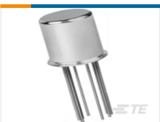
TE 产品编号1617164-7 JMACT-5XL = M28776/1-025L