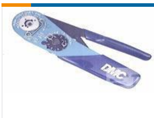
TE 产品编号 601966-1 CRIMPING TOOL M22520/2-01