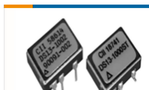
TE 产品编号3-1617813-1 DS13-1001S = RELAY