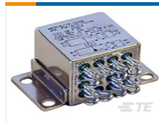
TE 产品编号5-1617808-1 TD228-1803P=TDFO 10 SEC M83726 /28-1803P