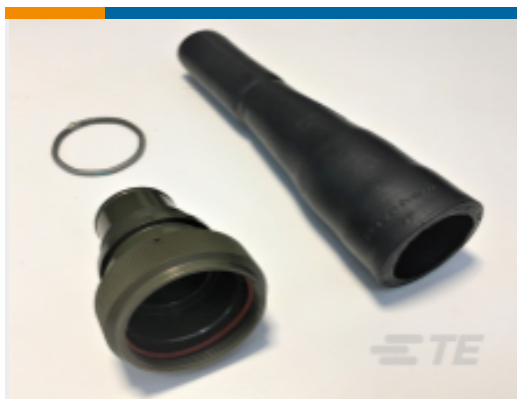
TE 产品编号606375N002 202D263-4-61-0-CS5077