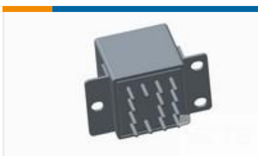
TE 产品编号2-1617805-4 TD228-3002P=TDFO 30 SEC M83726 /28-3002P