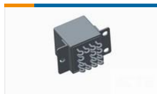
TE 产品编号1617806-3 TD228-5000S=TDFO .5 SEC