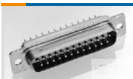
TE 产品编号1757823-5 AMPLIMITE,ASY,PLUG,STD,90,ZN,5