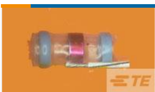
TE 产品编号092488N002 S02-10-R-3CS816