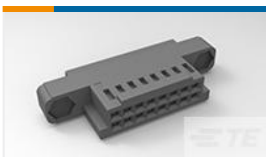
TE 产品编号1-88637-4 024 HOUSING FFC RCPT DR 100CL