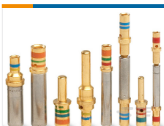
TE 产品编号0660-206-1631L CONT PIN