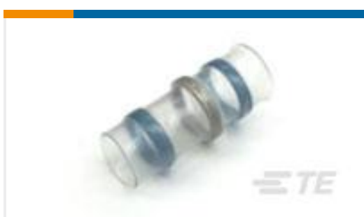
TE 产品编号054955-000 CWT-9001