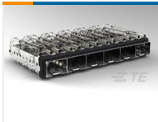
TE 产品编号 2007169-1 SFP 1x6 cage Assm Light Pipe, EMI gasket