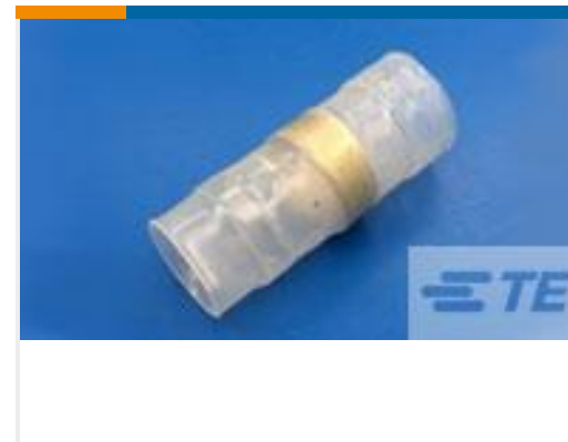
TE 产品编号 312172-000 B-053-70-01