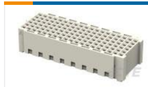
TE 产品编号 2102061-6 Mezalok, Socket, 114 p, 10 mm, 30 Au, LF