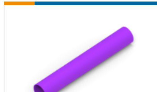
TE 产品编号NB21342001 RNF-100-1/8-VT-STK