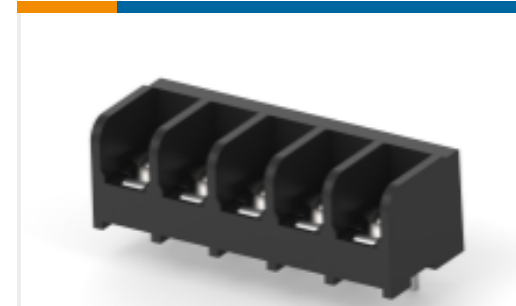
TE 产品编号8-1437652-6 6PCV-05-1341=#6 TRIBARRIER - S