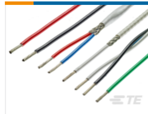
TE 产品编号379179-000 44A7620-20-4/2-4