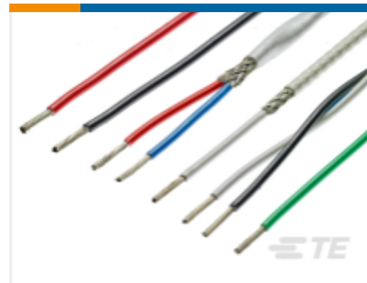
TE 产品编号278768-000 FLDWD0311-12-2