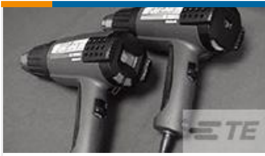
TE 产品编号 CJ2087-000 HL2010E-KIT-120V