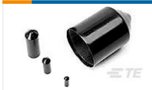
TE 产品编号843533-000 101A011-25-0