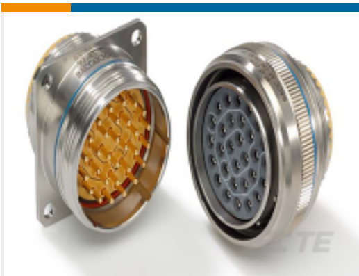
TE 产品编号ZPF000000000009123 983-7S 08-03 S6