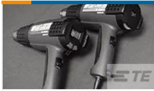
TE 产品编号 CJ2087-000 HL2010E-KIT-120V