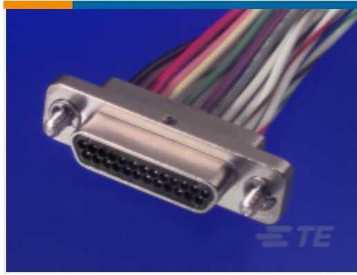
TE 产品编号2-1532172-7 M83513/04-B11C, MCKS-C2-B-15S6Q9-18.0