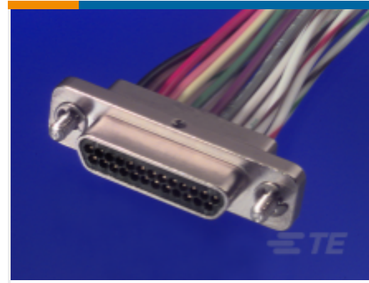
TE 产品编号2-1532176-7 M83513/04-F11C, MCKS-C2-B-37S6Q9-18.0