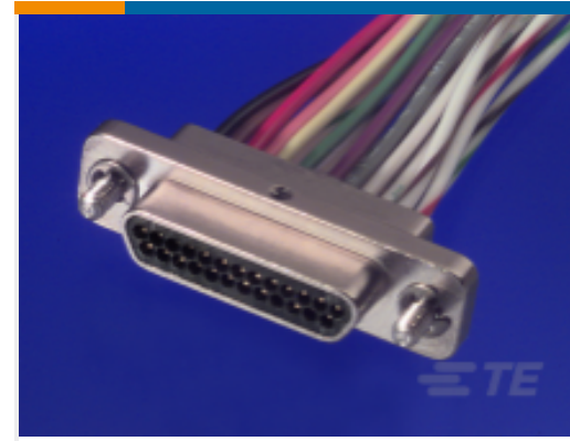
TE 产品编号2-1532184-8 M83513/03-F12C, MCKS-C2-B-37P6Q9-36.0