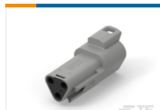
TE 产品编号3-2600026-1 3CCT GREY RECEPT W/LARGE SEAL