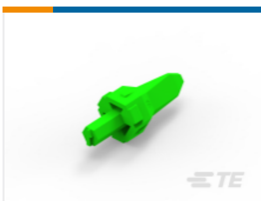
TE 产品编号2600028-1 3CCT RECEPT WEDGELOCK STANDARD GREEN