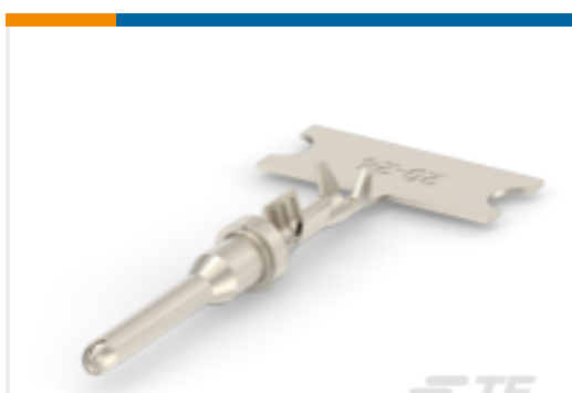
TE 产品编号3-2600020-2 XRC PIN TERMINAL 14-18AWG Ni Plated