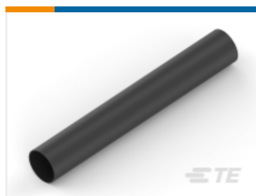
TE 产品编号NB11966001 ATUM-9/3-0-40MM