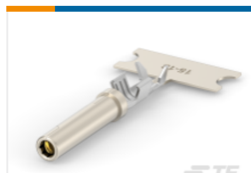
TE 产品编号3-2600021-5 XRC SOCKET 14-18 AWG Gold Plated