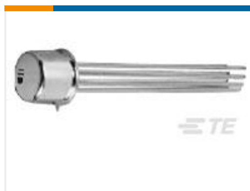
TE 产品编号4-1617119-1 J1MSP-12XL = M39016/10