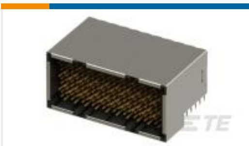
TE 产品编号2102247-2 Fortis Zd 3PR EMI Assy RA Diff 93/7 SnPb