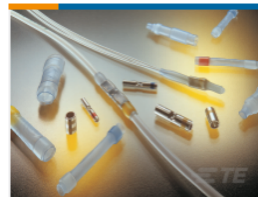
TE 产品编号650126N004 D-436-82CS2705