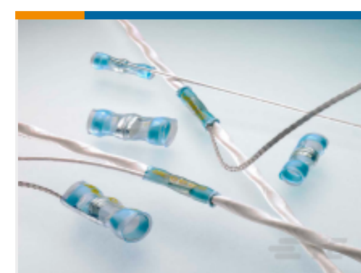
TE 产品编号626023-000 D-711-03