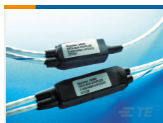
TE 产品编号279316-000 D-500-04-C23-072