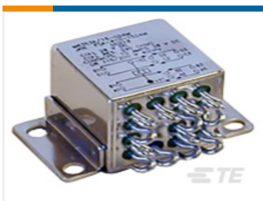
TE 产品编号4-1617813-6 TD228-7500P=TDFO .75 SEC M83726 /28-7500P