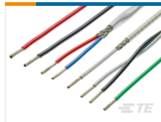
TE 产品编号387778-000 44A1111-22-90-9