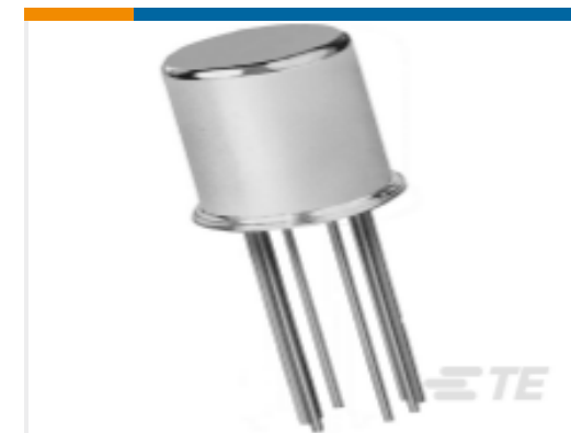
TE 产品编号6-1617540-4 J1MAP-6XL=M39016/7-016L