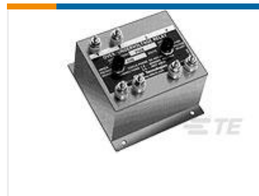
TE 产品编号5-1618071-6 253-5X=WILMAR OVER /UNDERVOLTAGE