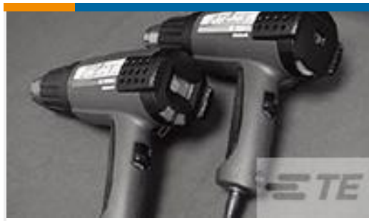
TE 产品编号 CJ2087-000 HL2010E-KIT-120V