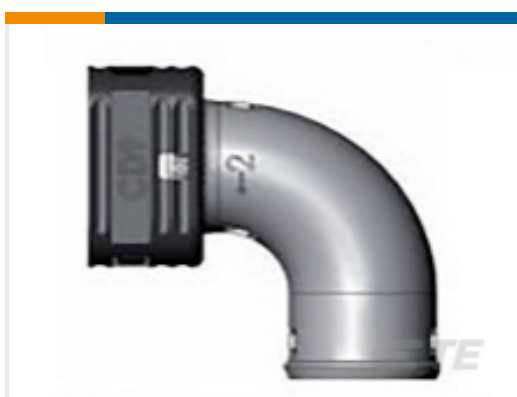
TE 产品编号ZPF000000000102764 787-8055-30M