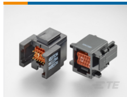
TE 产品编号ABC03N-20P IN-LINE RECP