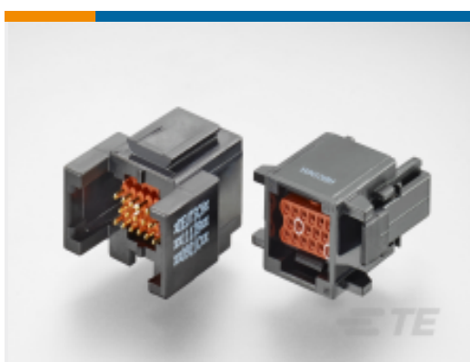
TE 产品编号ABC06N-22P IN-LINE PLUG