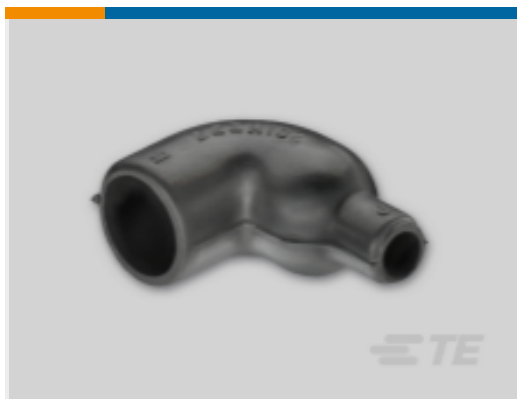
TE 产品编号806823-000 球形热缩护套：有嘴，直角