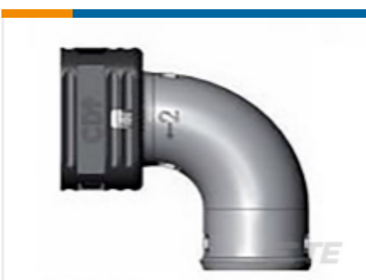
TE 产品编号 ZPF000000000102764 787-8055-30M