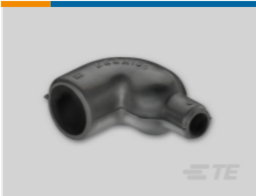
TE 产品编号 806823-000 球形热缩护套：有嘴，直角