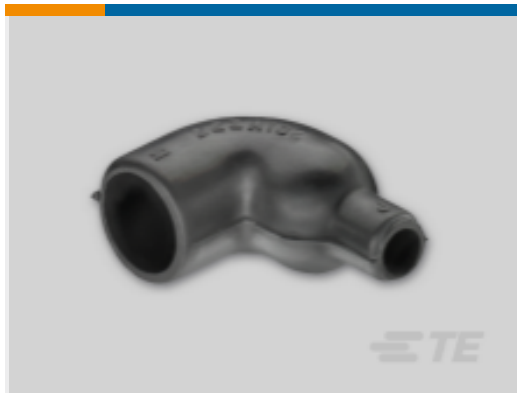
TE 产品编号 806823-000 球形热缩护套：有嘴，直角