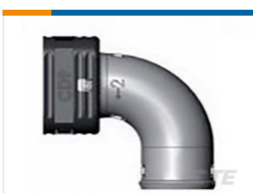
TE 产品编号 ZPF000000000102764 787-8055-30M