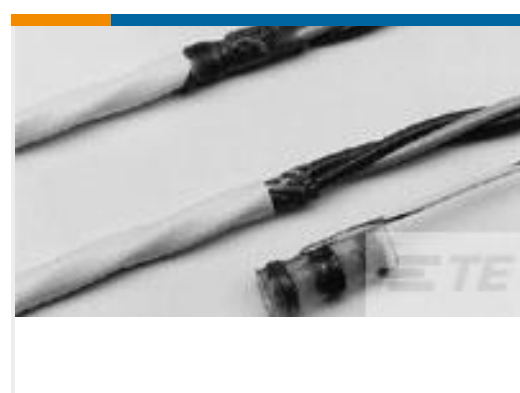
TE 产品编号 C88166-000 S200-1-W1-22-9