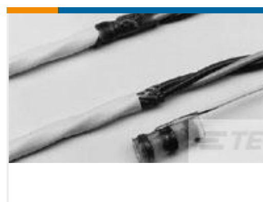
TE 产品编号 A74731-000 S200-2-W1-22-9