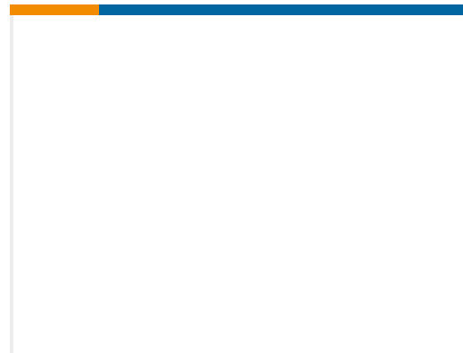
TE 产品编号1SNA103969R0300 AFSE 100 G ORANGE