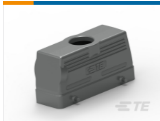
TE 产品编号T1220240132-000 H24B-TG-M32