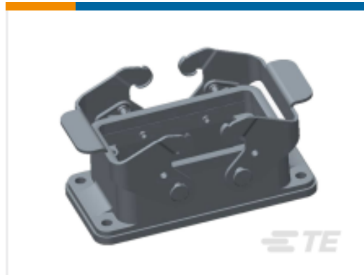
TE 产品编号T1410102000-000 H10B-AG