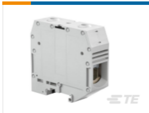
TE 产品编号1SNK526010R0000 ZS95