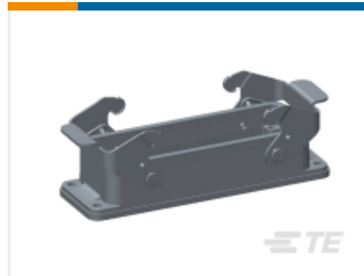
TE 产品编号T1410242000-000 H24B-AG