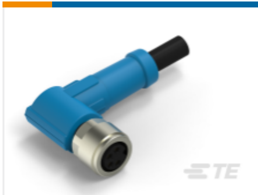
TE 产品编号T4051410004-004 M8 CABLE RA FEMALE 3M 4P PVC CABLE