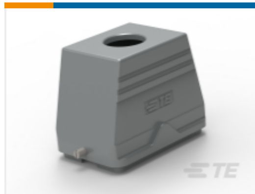
TE 产品编号T1320480132-000 H48B-TG-RO-M32