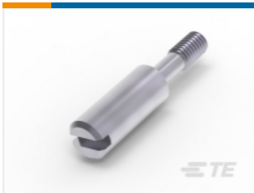
TE 产品编号T0931003003-000 CODING-PIN-M3