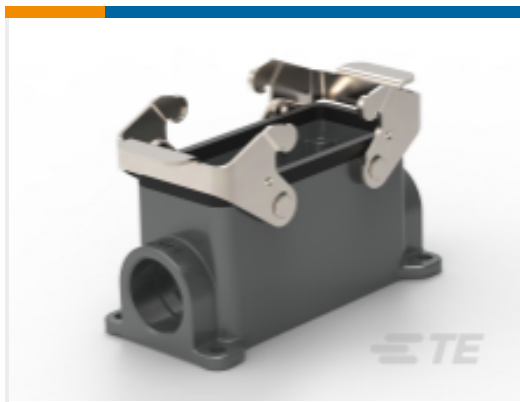
TE 产品编号T1440162221-000 H16B-SGR-2PG21