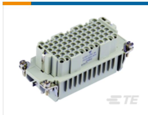
TE 产品编号T2030722201-000 HDD-072-F