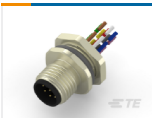
TE 产品编号T4171220008-002 M12,FRONT MOUNT,MALE, A, 8P, 0.5 M WIRE