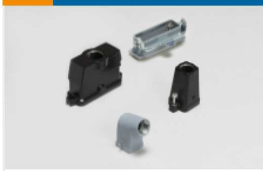
矩形连接器护罩和底座(1258)