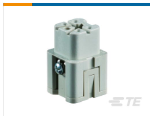
TE 产品编号T2010043201-000 HA-004-FS