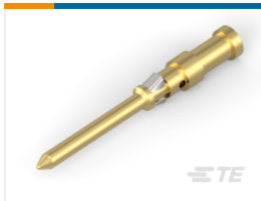
TE 产品编号T2020011002-000 DDM-0.3