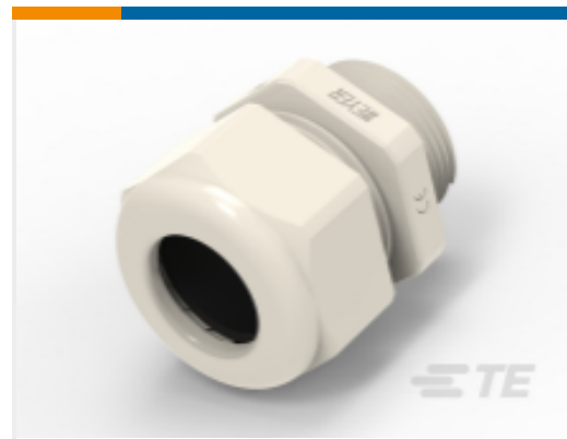
TE 产品编号T3209111201-000 HSK-P11G