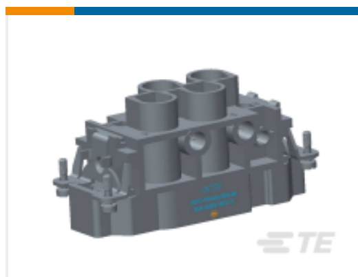
TE 产品编号T2100042101-000 HK4/0-004-M,WITH ONE SLOT SCREW