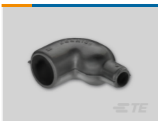
TE 产品编号806823-000 球形热缩护套: 有嘴, 直角