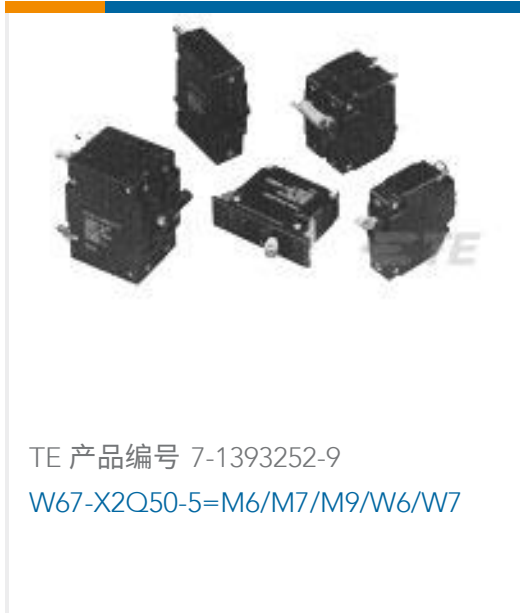
TE 产品编号 7-1393252-9 W67-X2Q50-5=M6/M7/M9/W6/W7