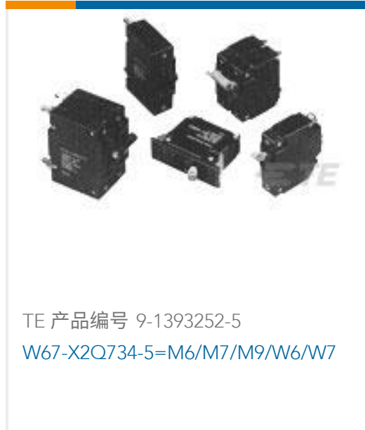
TE 产品编号 9-1393252-5 W67-X2Q734-5=M6/M7/M9/W6/W7