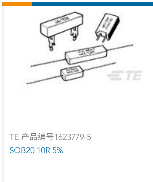
TE 产品编号1623779-5 SQB20 10R 5%