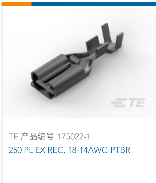
TE 产品编号 175022-1 250 PL EX REC. 18-14AWG PTBR