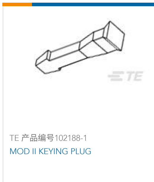
TE 产品编号102188-1 MOD II KEYING PLUG