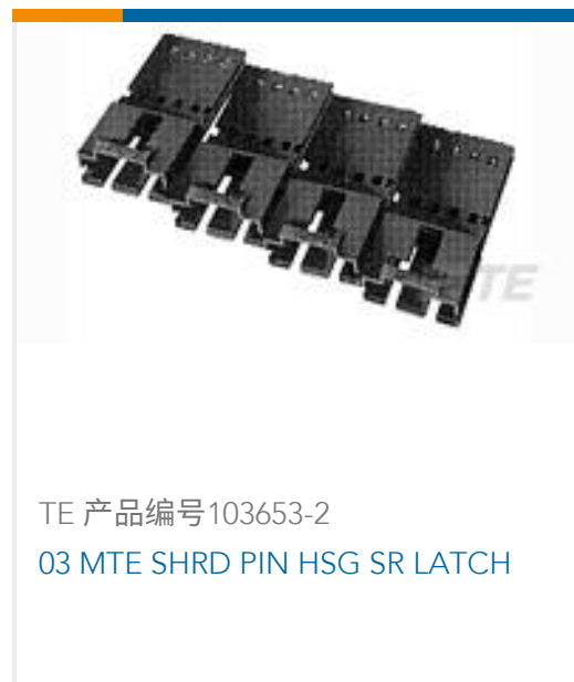
TE 产品编号103653-2 03 MTE SHRD PIN HSG SR LATCH