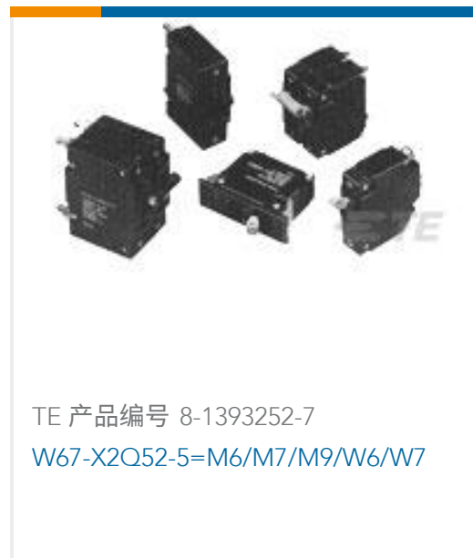
TE 产品编号 8-1393252-7 W67-X2Q52-5=M6/M7/M9/W6/W7