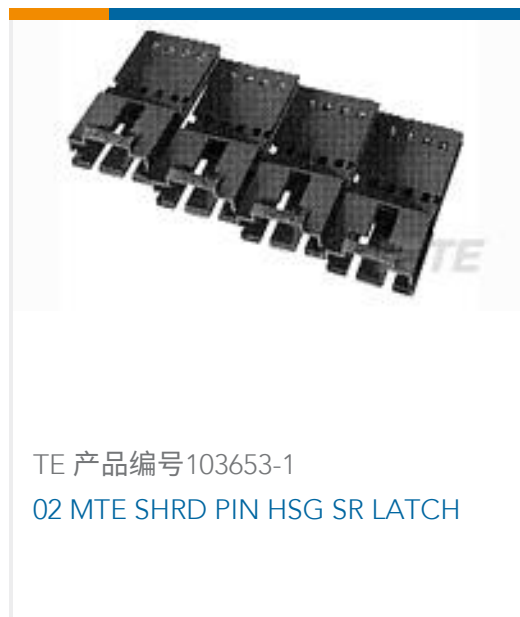
TE 产品编号103653-1 02 MTE SHRD PIN HSG SR LATCH