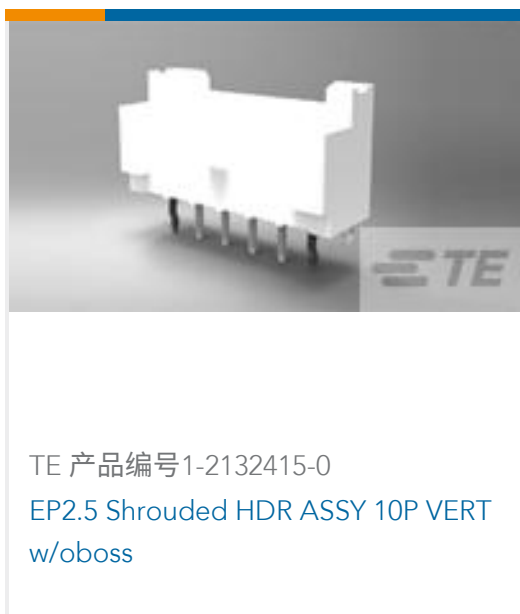
TE 产品编号1-2132415-0 EP2.5 Shrouded HDR ASSY 10P VERT w/oboss