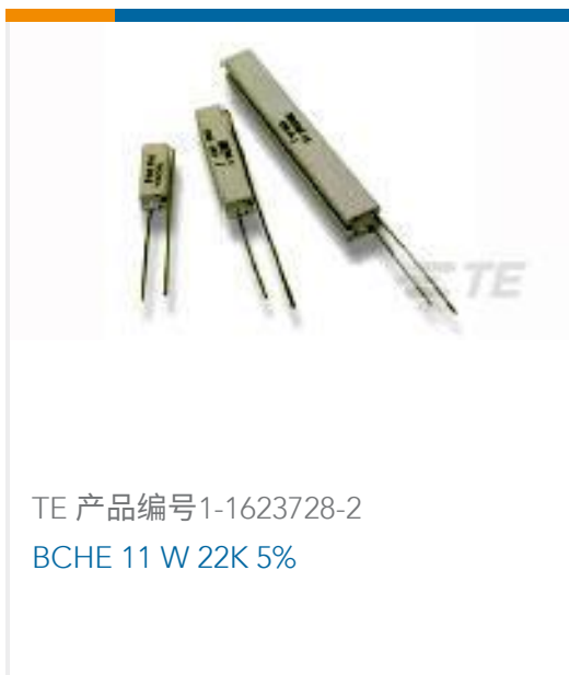
TE 产品编号1-1623728-2 BCHE 11 W 22K 5%