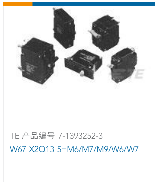
TE 产品编号 7-1393252-3 W67-X2Q13-5=M6/M7/M9/W6/W7