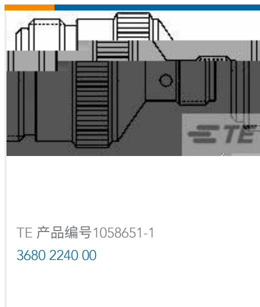
TE 产品编号1058651-1 3680 2240 00