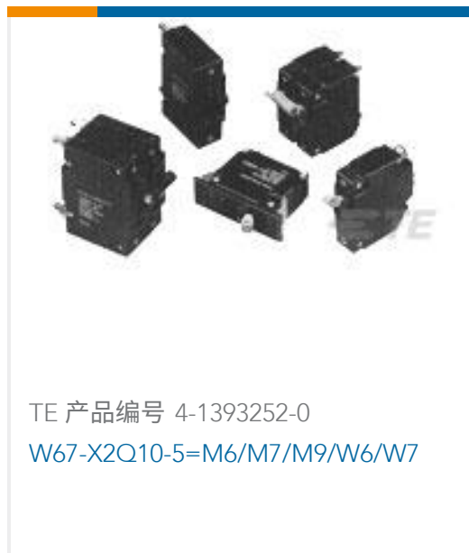
TE 产品编号 4-1393252-0 W67-X2Q10-5=M6/M7/M9/W6/W7