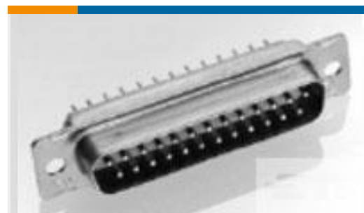
TE 产品编号1757819-3 AMPLIMITE,ASY,PLUG,STD,109,ZN,3