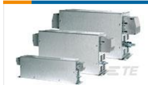
TE 产品编号1609989-3 30BCF10=F8234