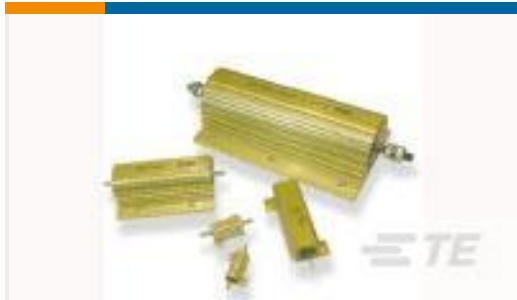
TE 产品编号1630019-1 HSC200 100R 5%