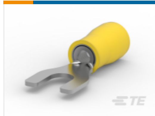
TE 产品编号 8-32589-2 TERMINAL,PIDG SPD 12-10 10