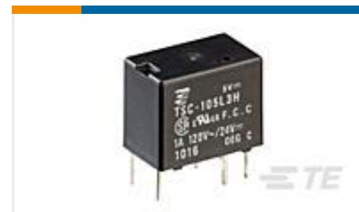
TE 产品编号2-1419130-1 TSC-112D3H,000