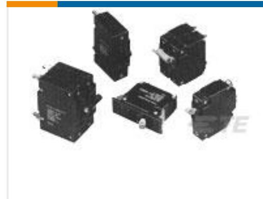
TE 产品编号 8-1393254-3 W92-X112-50=M6/M7/M9/W6/W7