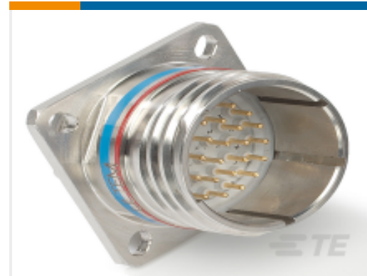
TE 产品编号YDTS20W19-35PNV001 RECP ASSY