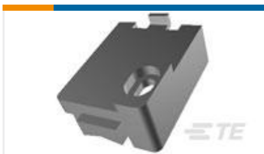
TE 产品编号1-640721-0 06P UMNL STR/REL & INSRT NATL