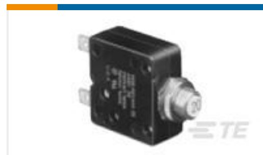
TE 产品编号1-1393249-1 W58-XB1A4A-2=W58