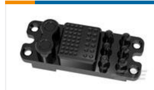
TE 产品编号1648186-1 292-10-01100=SA CONN,SKT