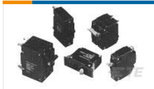
TE 产品编号 2-1393254-2 W91-X112-10=M6/M7/M9/W6/W7