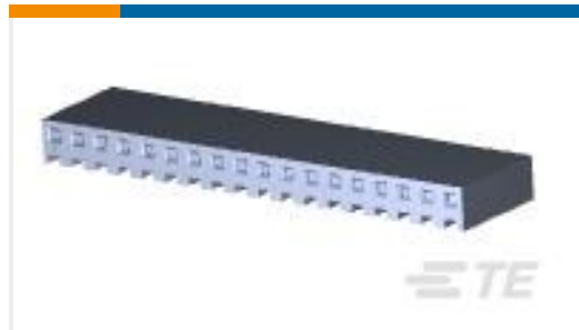
TE 产品编号1-640251-8 18P SL156 HSG W/O LCK RAMP