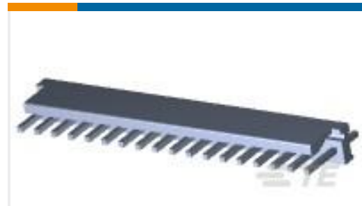
TE 产品编号1-644752-8 18P MTA156 HDR ASSY SQ STR F/L