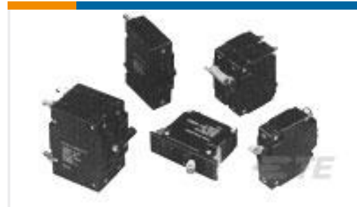
TE 产品编号 1-1393254-6 W91-X1110-10=M6/M7/M9/W6/W7