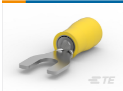
TE 产品编号 8-32589-2 TERMINAL,PIDG SPD 12-10 10