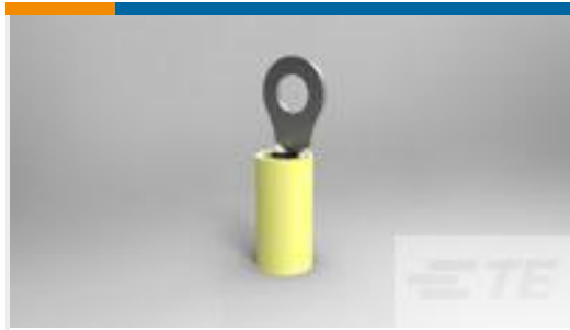
TE 产品编号 2-36161-3 TERMINAL,PIDG R IR 12 10