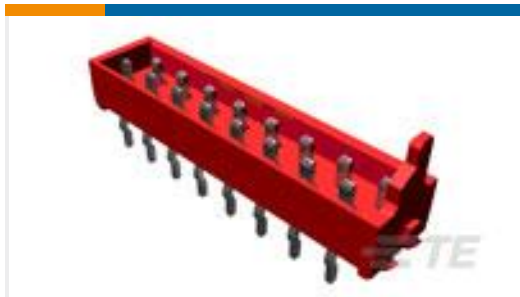
TE 产品编号1-215464-6 16P.MICRO-MATCH MOB