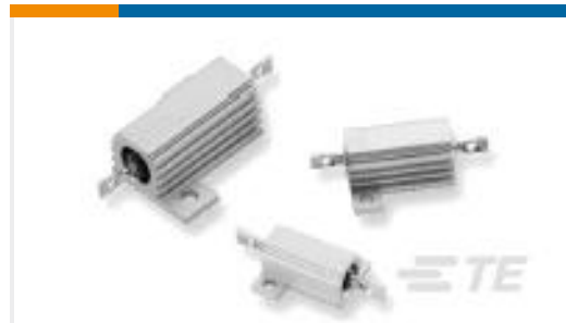
TE 产品编号1-1879071-7 THS50 2R7 5%