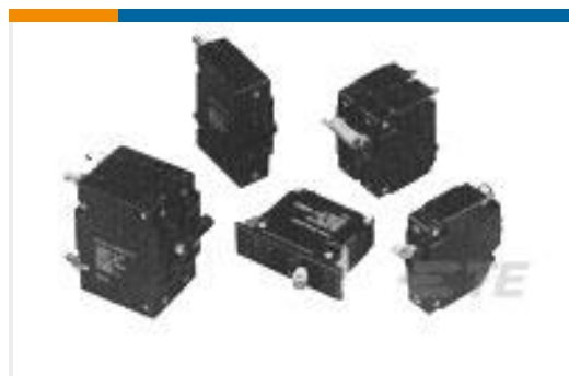
TE 产品编号1-1393255-2 W93-X112-5=M6/M7/M9/W6/W7