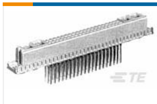
TE 产品编号148423-5 EURO TYPE M REC 42+6, THIN STK