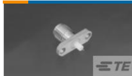
TE 产品编号1052926-1 2052 8002 92