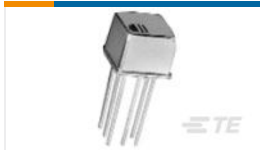
TE 产品编号1-1617150-0 JMGSCD-26MW = M39016/42-052M