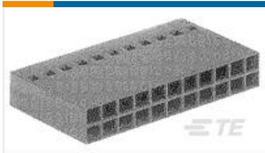
TE 产品编号1-104482-5 34 SHORT PT RCPT HSG DR .100CL