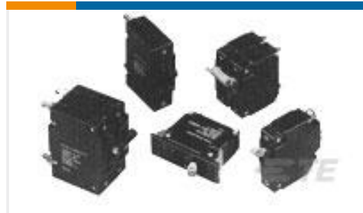
TE 产品编号 5-1393254-0 W91-X152-50=M6/M7/M9/W6/W7