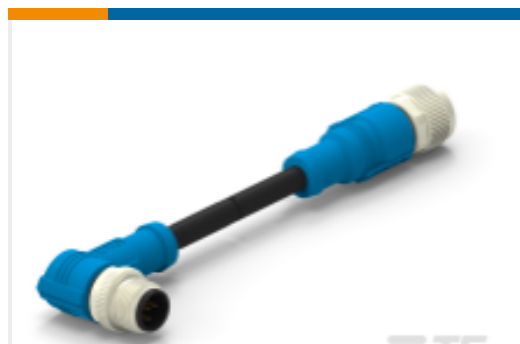
TE 产品编号T4162213005-005 RPC-M12-5MR-5.0SH-M12-5FS-PVC