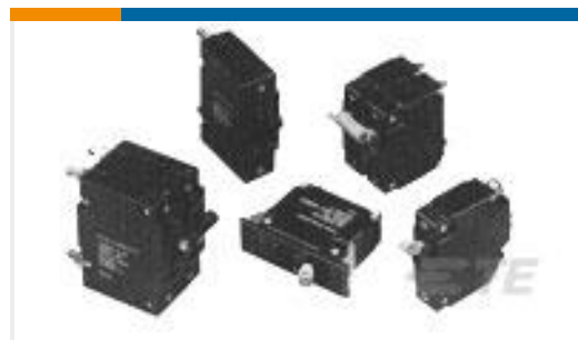
TE 产品编号 2-1393254-5 W91-X112-20=M6/M7/M9/W6/W7