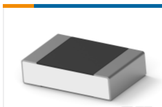
TE 产品编号1-2176381-5 RQ 0805 17K4 0.1% 10PPM 5K RL