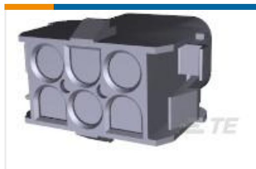
TE 产品编号1-480705-0 06P UMNL CAP HSG NATL