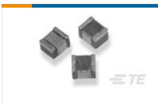
TE 产品编号1-1879023-0 3650 1008 39nH 5% 2K RL