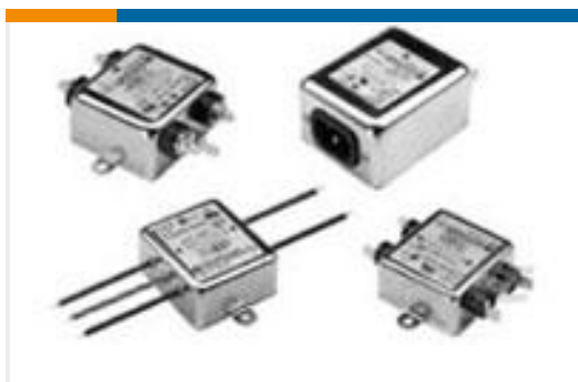
TE 产品编号1-6609028-8 10VK6=F7356 S0