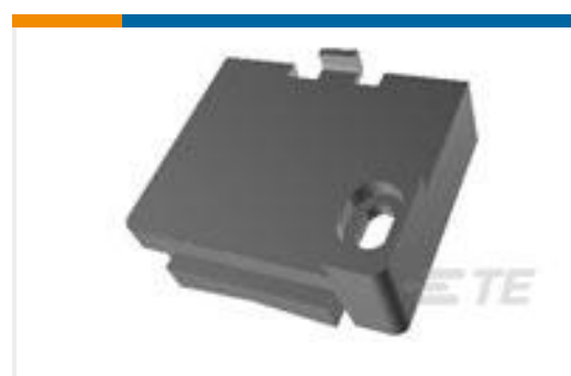
TE 产品编号1-640724-0 15P UMNL STR/REL & INSRT NATL