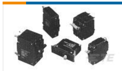
TE 产品编号 4-1393254-4 W91-X152-20=M6/M7/M9/W6/W7