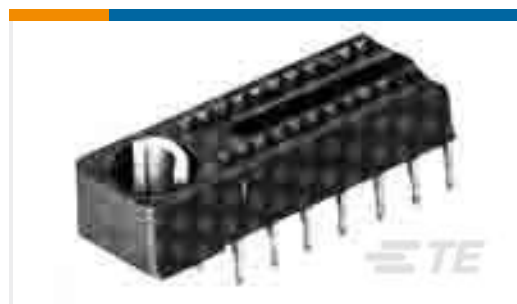
TE 产品编号2-530745-1 MINI BX RCPT ASSY 110P SEALED