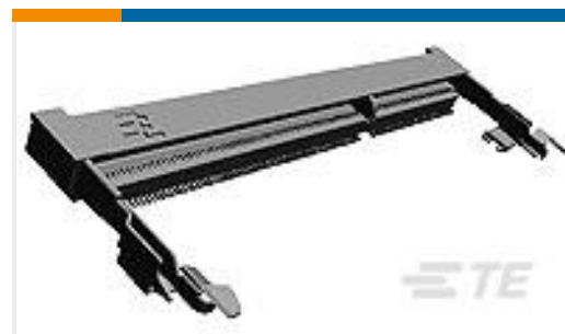
TE 产品编号2-2013289-1 EMBOSS TAPE DDR3 204P 5.2H STD