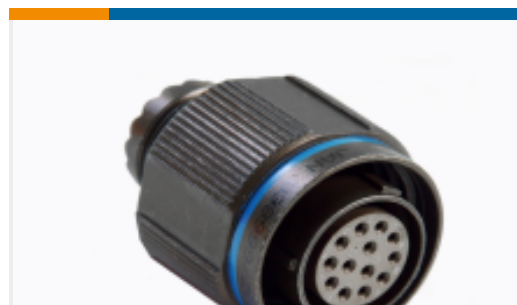
TE 产品编号YDTS26W17-06SNV001 PLUG ASSY