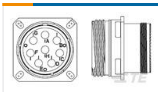
TE 产品编号1-1811927-4 8Q8 Size 25 Rcpt,A Key OD