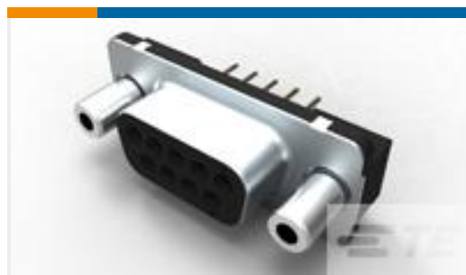
TE 产品编号1-5747150-6 09 RCPT SP/FMS SCRLK