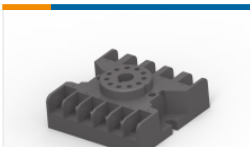
TE 产品编号1393143-7 27E123=SOCKET,KRP,11,SCW,PLE