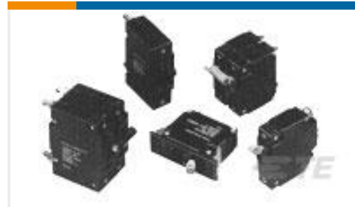
TE 产品编号 4-1393254-2 W91-X152-10=M6/M7/M9/W6/W7