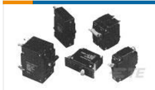
TE 产品编号 2-1393254-2 W91-X112-10=M6/M7/M9/W6/W7