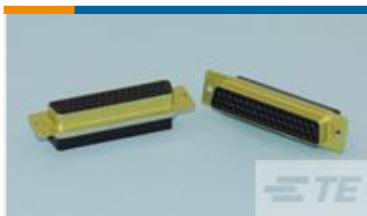
TE 产品编号1658640-2 RECP. ASSEMBLY SIZE 5