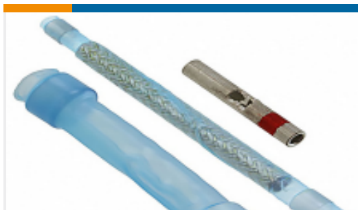
TE 产品编号 307416-000 D-150-1010