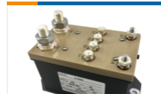
TE 产品编号4-1616058-2 A770WA2 (FAA/PMA)=RELAY