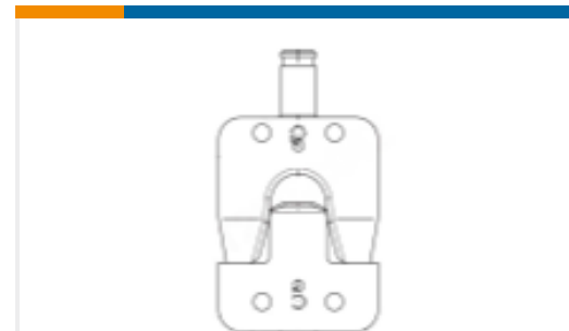
TE 产品编号2217781-1 DIE, 4/0 COPALUM, HT 30 DEG