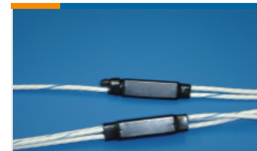
TE 产品编号CW0499-000 D-500-L458-2-4Y3-120