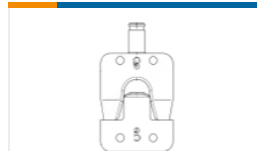
TE 产品编号2280034-1 DIE ASSY, 2/0 COPALUM 30 DEG