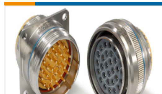
TE 产品编号ZPF000000000037175 983-6SE 22-19 P6