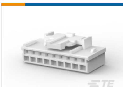
TE 产品编号1971030-9 9POS Plug Housing for GIC 2.0 EV Series