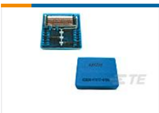
TE 产品编号4-1393801-1 V23030A1026A104