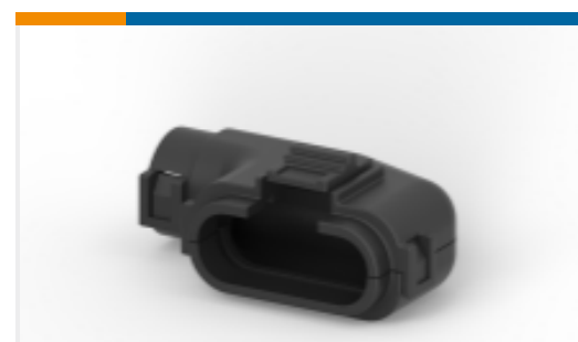
TE 产品编号2-2109570-2 MCON 5P PLUG COVER TYPE-C BLK