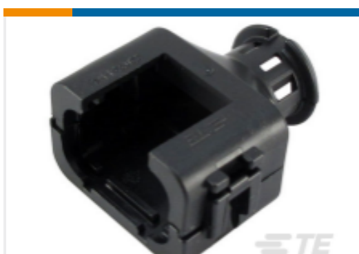
TE 产品编号2292798-1 AS16 BACKSHELL, 3P PLUG, SMOOTH EXIT, MC