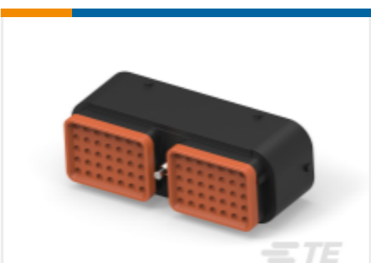
TE 产品编号DRC16-70SAE-P013UK PLG, 70P, BLK, E, SEAL BOND, A