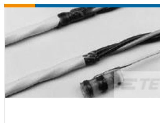
TE 产品编号A74731-000 S200-2-W1-22-9