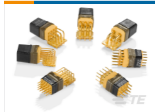
TE 产品编号ZPF000000000114204 732-8260-16