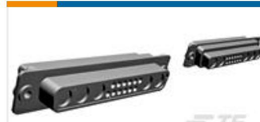
TE 产品编号445726-1 RECEPT ASSY,21C4,AMPLIMITE