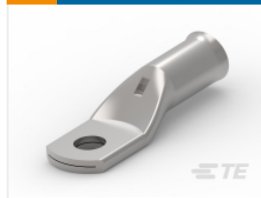
TE 产品编号710977-1 XCT 4-4