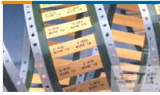
TE 产品编号707112-000 D-SCE-1K-6.4-50-S1-9