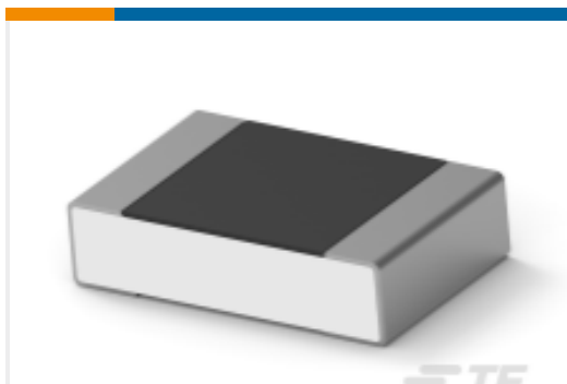
TE 产品编号3-2176376-7 RQ 0805 29K4 0.1% 10PPM 1K RL