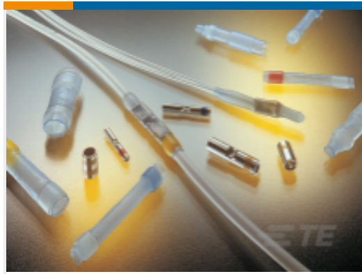
TE 产品编号326791-000 D-181-2222-90/9CS298