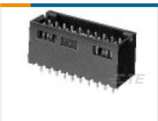
TE 产品编号 1-102318-1 20 MODII HDR DRST 3/4SHRD .100