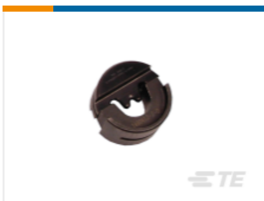
TE 产品编号 1-1490413-4 NEST, 90 DEG SOLISTRAND, 8