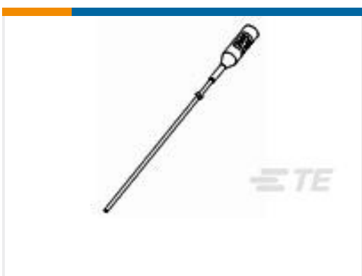
TE 产品编号 141749-000 D-500-0263-040