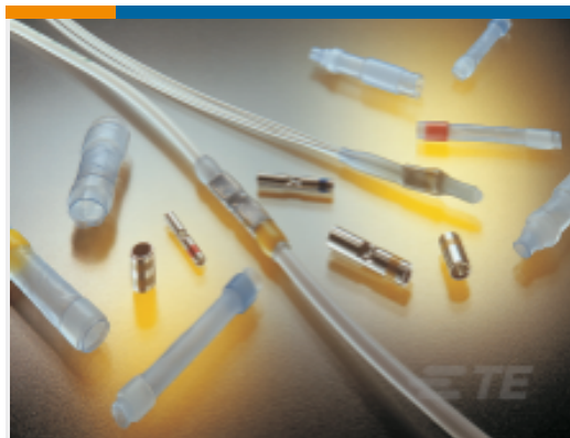
TE 产品编号650075N006 D-436-37CS391