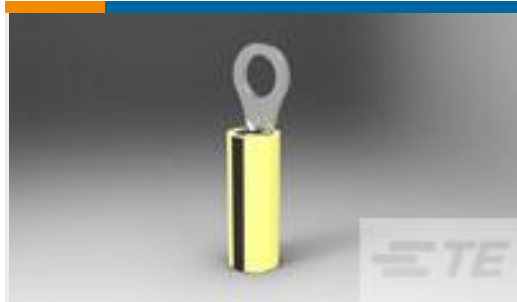
TE 产品编号53078 TERMINAL,PIDG R IR 26 2