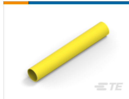
TE 产品编号NB18254001 RNF-100-2-YO-SP