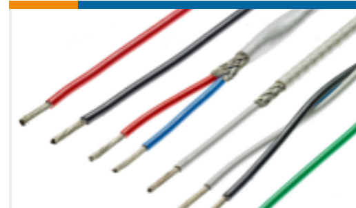
TE 产品编号732160-001 44AM4131-22-0/2/9-9