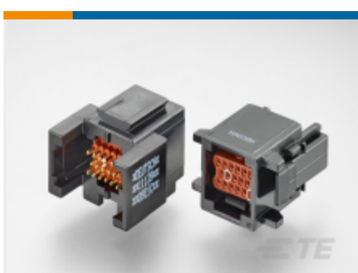
TE 产品编号 ABC06N-22P IN-LINE PLUG