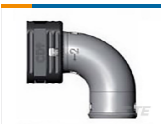
TE 产品编号ZPF000000000102764 787-8055-30M