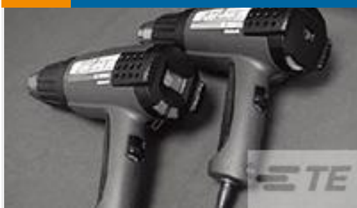
TE 产品编号 CJ2087-000 HL2010E-KIT-120V