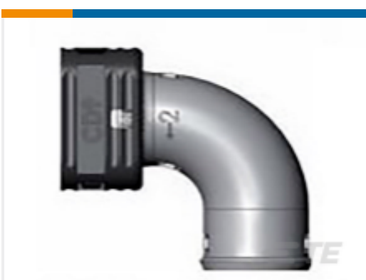
TE 产品编号ZPF000000000102764 787-8055-30M