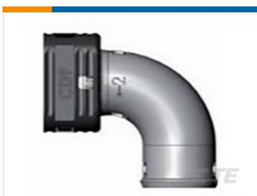
TE 产品编号ZPF00000000102764 787-8055-30M