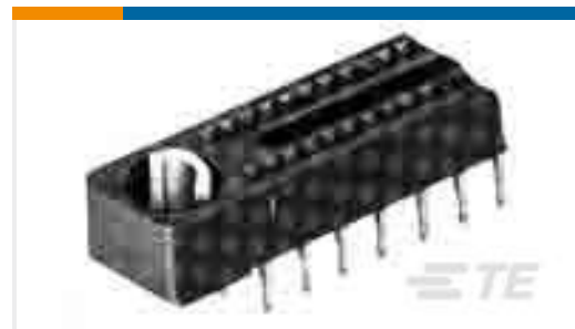
TE 产品编号2-530745-2 MINI BX RECPT ASSY 128P SEALED