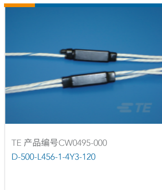
TE 产品编号CW0495-000 D-500-L456-1-4Y3-120