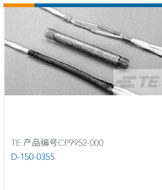
TE 产品编号CP9952-000 D-150-0355