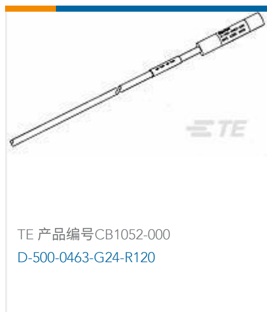
TE 产品编号CB1052-000 D-500-0463-G24-R120