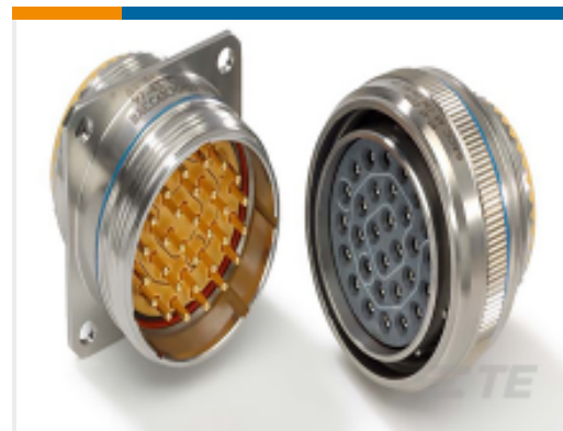
TE 产品编号 ZPF000000000037174 983-6SE 22-12 SN-L