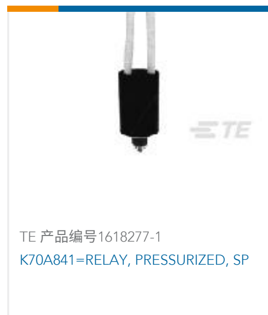
TE 产品编号1618277-1 K70A841=RELAY, PRESSURIZED, SP